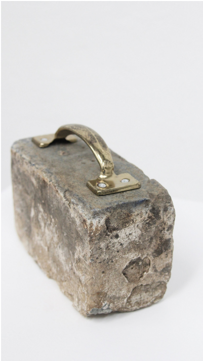
Título: EQUIPAJE Artista: KARLO ANDREI IBARRA Año: 2022 Técnica: MIXTA ACERO Dimensiones: 30x12x18 cm Descargar