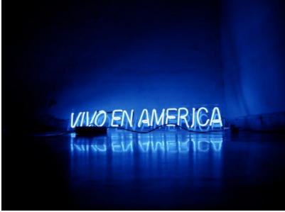
Título: VIVO EN AMERICA Artista: KARLO ANDREI IBARRA Año: 2025 Técnica: NEON Dimensiones: 140x23x4 cm Descargar